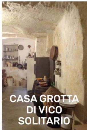
CASA GROTTA DI VICO SOLITARIO