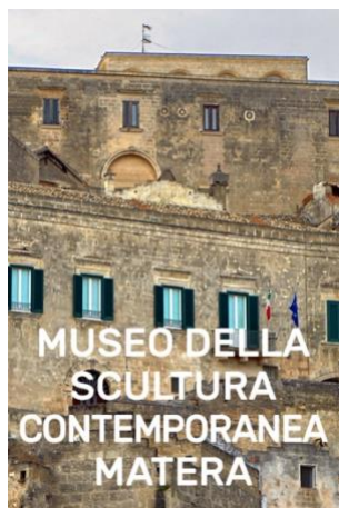
MUSEO DELLA SCULTURA CONTEMPORANEA MATERA